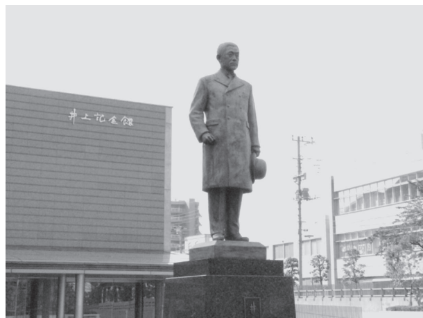
白山キャンパス井上円了像